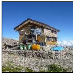
赤石山頂避難小屋