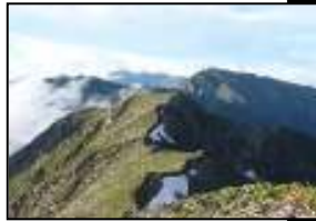
赤石から悪沢、白根